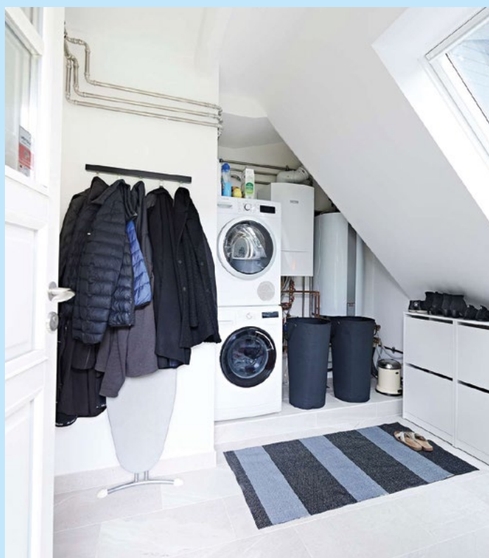
49.000 af Evidas kunder forventer at skifte til en anden opvarmingskilde inden for to år.

”Analysen giver vigtig viden om, hvad der driver gasforbrugernes valg, og hvad vi kan forvente de kommende år. Gassektoren, som ellers har udviklet sig stabilt over mange år, ser ind i markante