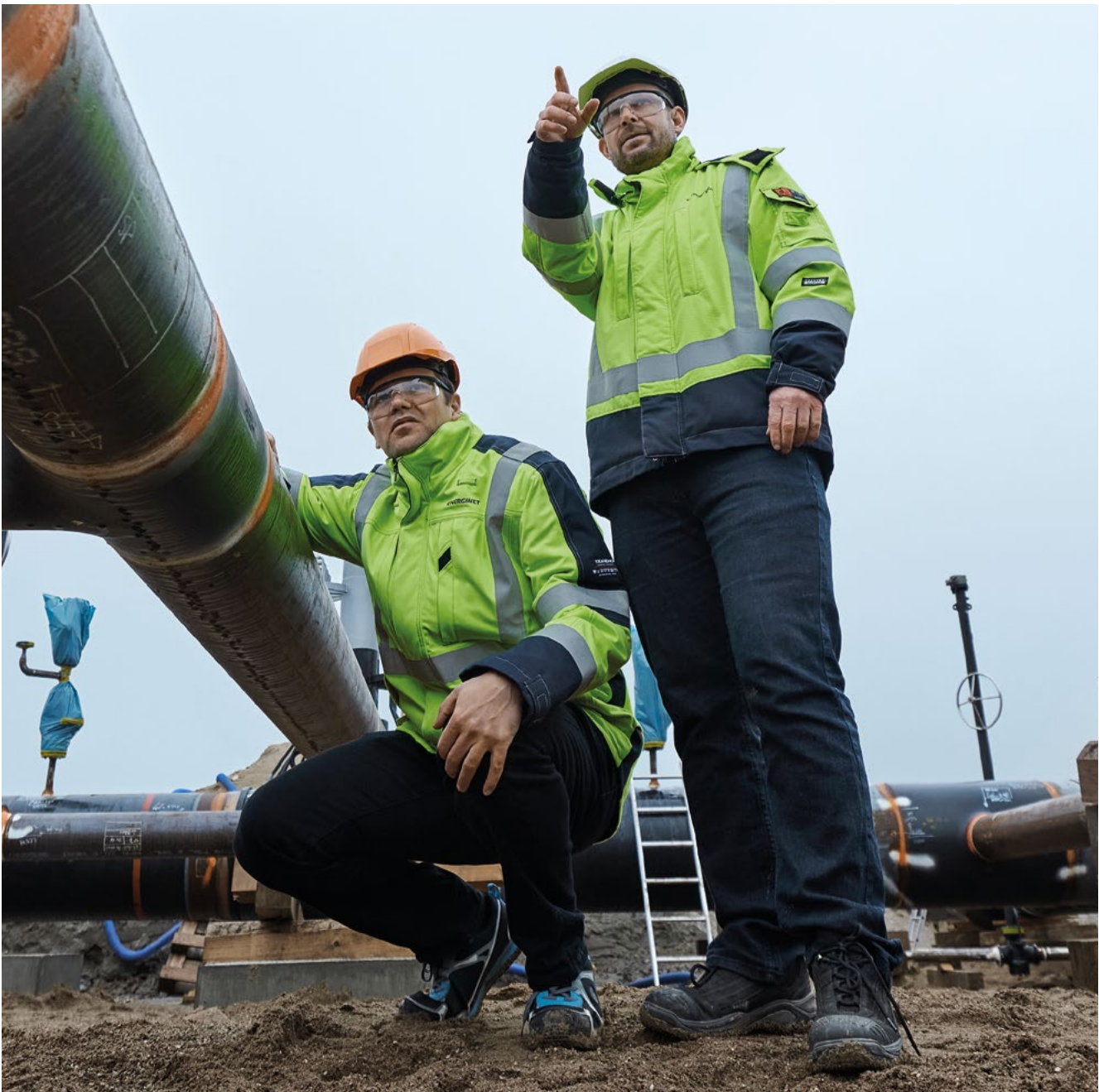
Det er vigtigt at planlægge, så investeringer støtter den grønne omstilling.

der bliver naturligvis baseret på de identificerede behov.