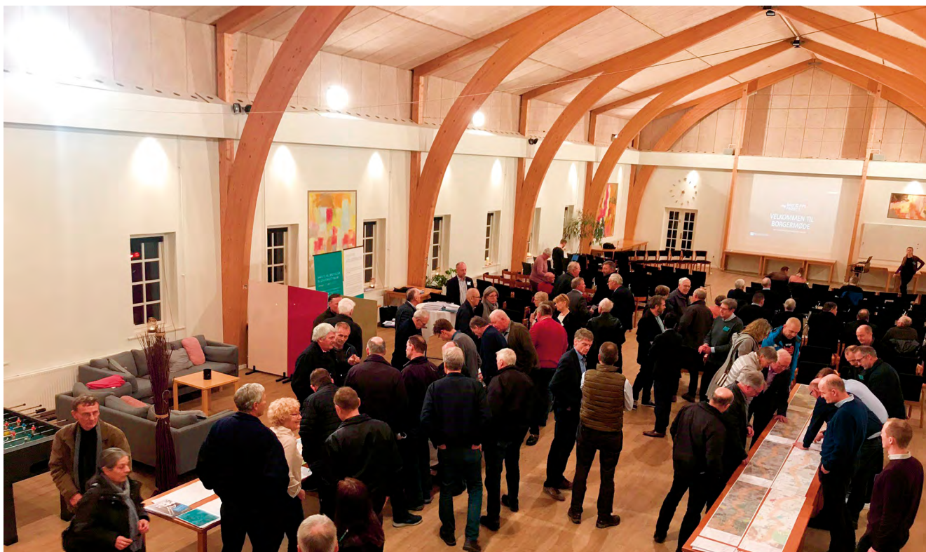
Der var stor interesse for borgermøderne.